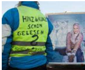
SIE kommt spät - aber sie KOMMT !! von Erich Heeder